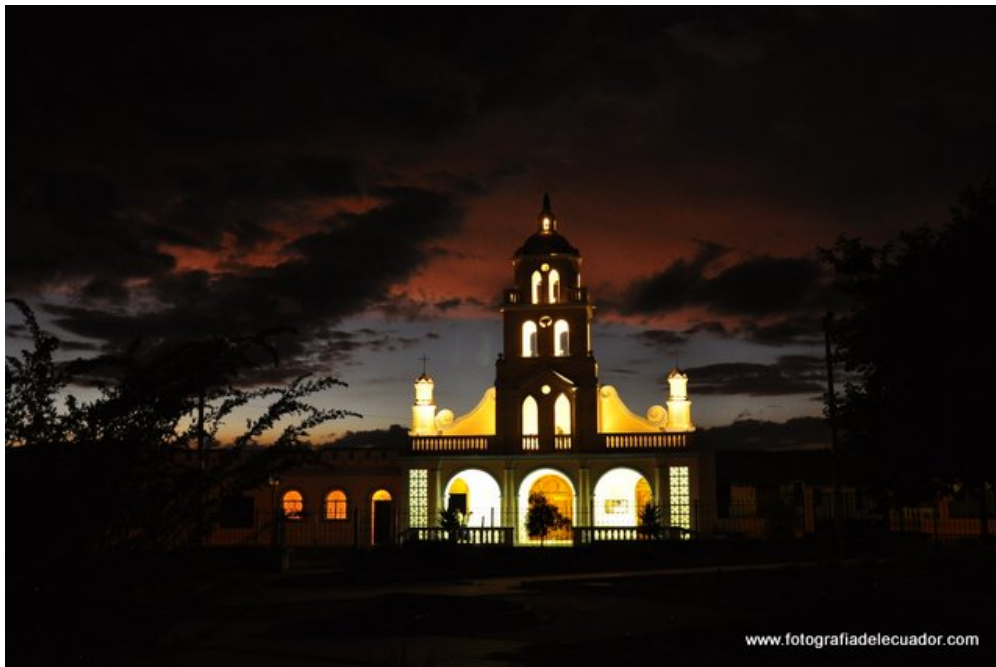
Church in small village of highlands Ecuador. 1/15sec. f4.0 ISO 1000 HANDHELD

El hecho de que el sol se ponga no significa que debas guardar la cámara, hay tantas oportunidades para fotografiar después del anochecer que realmente deberías intentarlo. También te ayudará a entender la luz.