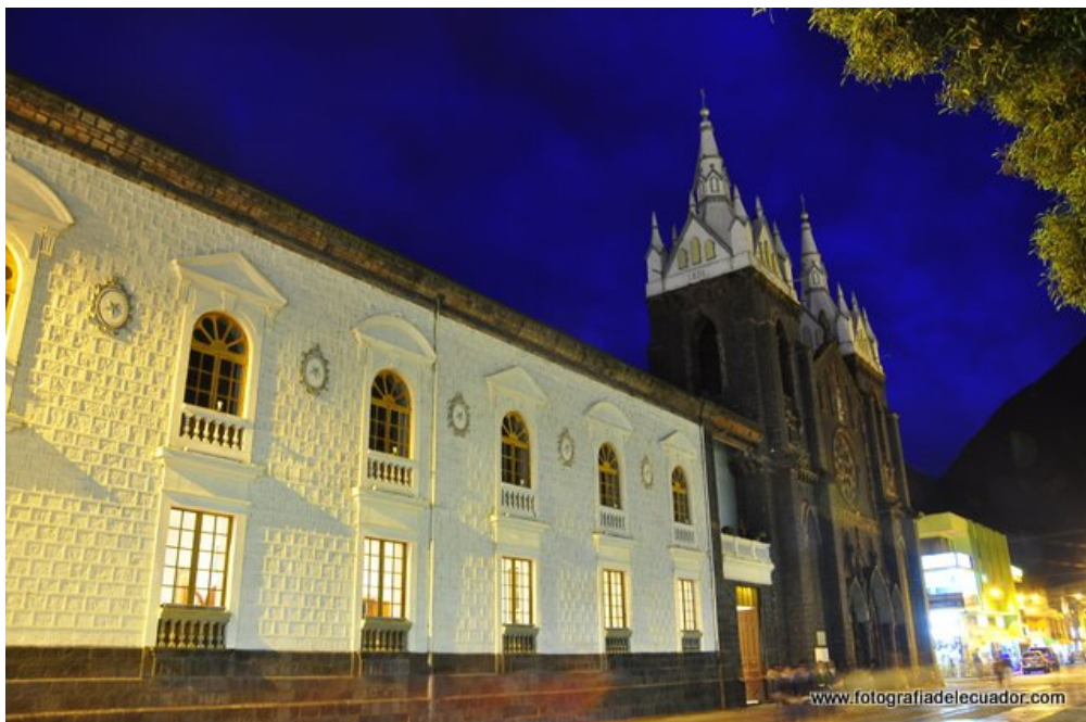
Iglesia en Baños-Ecuador. Configuración- 5 segundos f5.6 ISO 200

Asegúrate de apuntar la cámara a la parte más oscura de la escena, o algo a mitad de camino hacia la parte más oscura. Si las líneas están demasiado alejadas de la línea central, deberá ajustar ligeramente la configuración de la cámara, pero a veces pruebe la foto, vea qué sale. Puede ser muy oscuro o negro o muy claro o incluso blanco, así que cambie la configuración apropiadamente y tome otra foto.