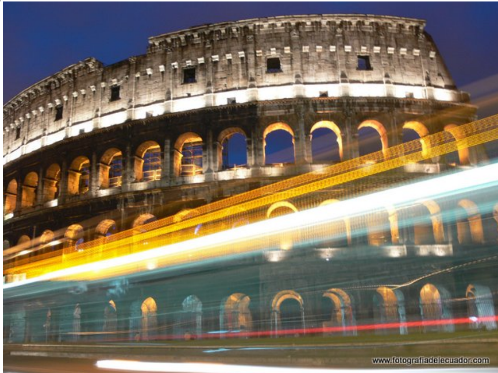
El Coliseo, Roma 6 seg f4.5 ISO 80 Utilicé un basurero para estabilizar la cámara

Disparador remoto, disparador por cable o disparador automático. Como la cámara está en un trípode o cualquiera de las otras opciones mencionadas, también habrá movimiento de la cámara si solo presiona el botón del obturador, así que use el disparador o, si no tiene uno, use el disparador automático. Recuerdo esto de hace años, mi papá, también fotógrafo, solía tomar fotos familiares presionando el botón y corriendo hacia la toma, estoy seguro de que muchos de ustedes también tendrán estos recuerdos, bueno, todavía funcionan hoy y hasta donde sé que todas las cámaras, incluso las más pequeñas y sencillas, las tienen, así que aprovéchalas. El símbolo parece un pequeño reloj. el mejor momento es cuando todavía queda un poco de azul en el cielo, esto creará las mejores tomas.